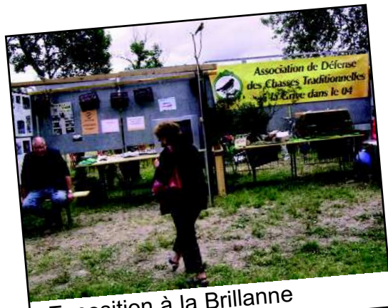
Exposition à la Brillanne