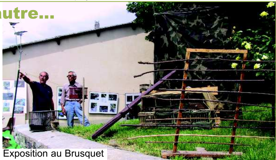
Exposition au Brusquet