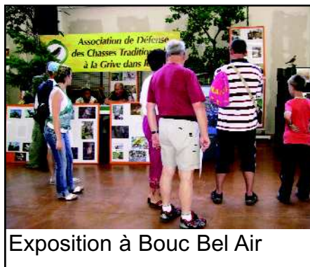
Exposition à Bouc Bel Air

Nous sommes de plus en plus sollicités pour présenter notre exposition sur les chasses traditionnelles. Les visiteurs toujours intéressés se souviennent, leurs parents, grands parents les ayant pratiquées. Ces souvenirs parfois lointains restent néanmoins très présents. Les lequettes demeurent une image incontournable. Que se soit à l'occasion de la foire de la Brillanne ou la société de chasse, la Brillannaise a accueilli notre association pour y présenter son exposition.