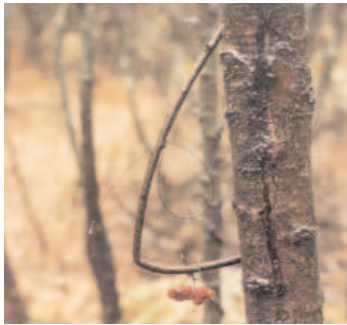
Semi-ogivale à fixation verticale en deux points (type dominant chez les Ardennais du plateau).

La tenderie à la branche ou au brancher nécessite une série d'opérations bien précises dont la connaissance se transmet de manière rituelle. Pour toute nouvelle tenderie, la première opération consiste en la préparation du «trait de grivière» c'est-à-dire la réalisation d'un tracé sinueux dans le taillis sous la forme d'un sentier.