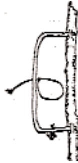
Rectangulaire à fixation verticale en deux points.

La « pliette » est faite avec une jeune pousse de la grosseur d'un crayon, taillée en biseau à chaque extrémité. Sont souvent utilisées les branches de bourdaine dont la longévité est de 3 à 4 ans, ou à défaut, les branches de chêne qui ont l'avantage de se greffer sur le support si elles sont posées avant la montée de la sève (en Mars). Sont utilisées accessoirement les branches de noisetier qui ne durent qu'une saison, les rejets de saule ou bien encore les branches