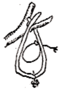
Ovale à fixation oblique en un point.

La forme la plus utilisée dans les Ardennes est la forme en arceau (en fait semi-ogivale à la pose).